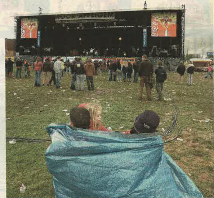
Rock Affligem beleefde een van de grootste dieptepunten uit zijn geschiedenis. Zaterdag werd de weide op evenveel regenvlagen als optredens getrakteerd.

Met wat geluk komt Rock Affligem dit jaar net uit de kosten maar voor de talloze vrijwilligers, die zich inspanden om goede doelen te kunnen steunen, was deze editie moreel alweer geen opsteker.